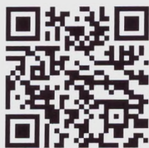
QR-код, сайт ломбарда